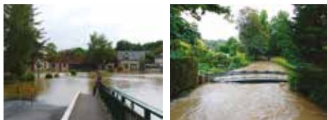
La Cisse - Crue de juin 2016 - Moulineuf (41)

Le Maire élabore le DICRIM qui synthétise les informations transmises par le Préfet, complétées des mesures de prévention et de protection et prises par lui-même.